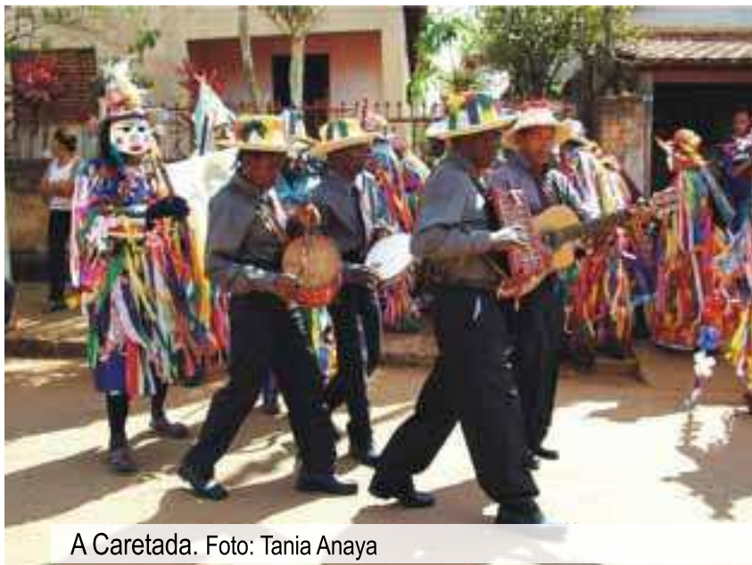
A Caretada. Foto: Tania Anaya