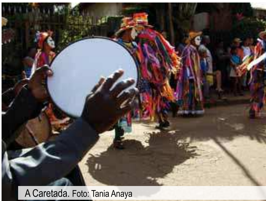
A Caretada.

Por causa das ameaças ao ambiente, trazidas pela expansão da dominação da grande mineradora, a comunidade pede à Justiça o tombamento dos locais de importância histórica e cultural para os quilombolas, como a Igreja de Santo Antônio da Lagoa e o cemitério a ela adjacente, e também um local conhecido como a lapa de Santo Antônio Vivo, que margeia a estrada MG 188.