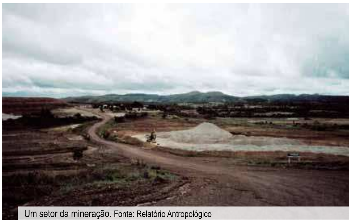
Um setor da mineração.

Hoje, toda a população de Paracatu está exposta às substâncias tóxicas dos rejeitos da mineração. Várias pesquisas e notícias, algumas reunidas no Mapa de Conflitos Envolvendo Injustiça Ambiental e Saúde no Brasil (estudo realizado pela Fiocruz e pela Federação de Órgãos para Assistência Social e Educacional), apontam a mineração como principal causa de grande número de casos de doenças renais, neurológicas, cardiovasculares, e, principalmente, câncer, além de mutações genéticas, na região. O ar e as águas, principalmente na barragem de rejeitos (a maior do mundo), têm níveis enormes de contaminação por metais pesados. As nascentes foram todas comprometidas. Mesmo com ações e denúncias por diversos órgãos, a exploração aumenta a cada ano, avançando sobre as fazendas e os bairros de Paracatu. Muitos ativistas são ameaçados, tendo que fugir da região. Todo o riquíssimo universo cultural da Família dos Amaros e de outros grupos quilombolas da região pode desaparecer, juntamente com seu território.