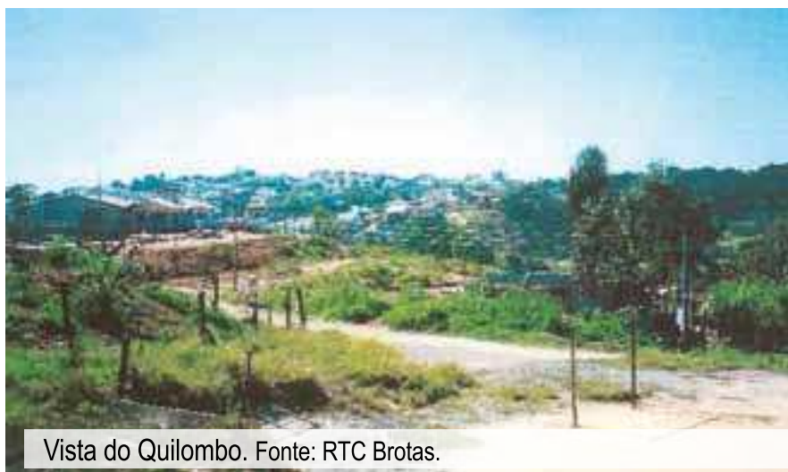
Vista do Quilombo.

Com o processo de reconhecimento enquanto quilombolas, os familiares conseguiram interromper as obras do loteamento Nova Itatiba II