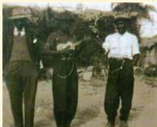
Festa no Quilombo (1950-1955)