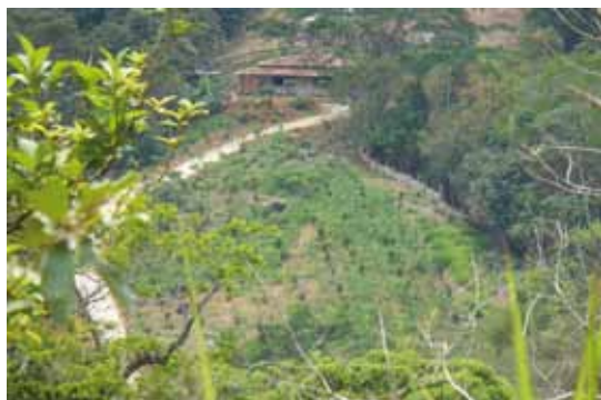
Primeira casa de veraneio construída no território reivindicado, em trecho sem documentação regular

Atualmente, a agricultura na comunidade fica quase exclusivamente nos quintais, por conta das várias interdições ambientalistas. Cabral está situado dentro da Área de Proteção Ambiental Cairuçu, na Baía da Ilha Grande, onde há a maior concentração de Mata Atlântica do Rio de Janeiro e próximo a outras unidades de conservação. Isso tem restringido o sistema tradicional da coivara. Ainda assim, os moradores plantam diferentes culturas em meio às espécies nativas.