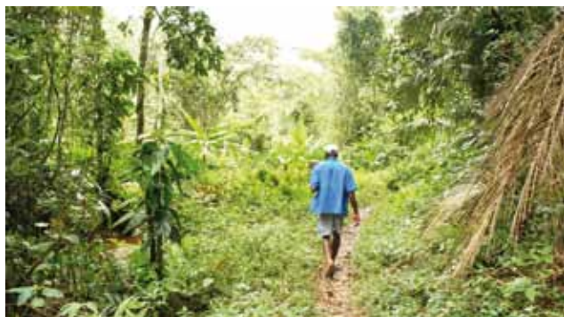
Área verde no Quilombo de Cabral

A situação enfrentada pelas comunidades do Fórum expressa o paradoxo vivido por outras comunidades tradicionais sobrepostas a unidades de conservação de proteção integral. O Quilombo de Cabral está situado em uma área rica em nascentes e matas preservadas porque as próprias famílias negras assim as mantiveram. Foi devido ao modo como se relacionaram com o território ao longo de um século que o patrimônio ambiental de Paraty foi preservado. Sua luta é por isso também uma garantia da preservação desse patrimônio contra as pressões do turismo e da especulação imobiliária. É a evidência viva de uma trajetória de força, articulações e resistência negra na região.