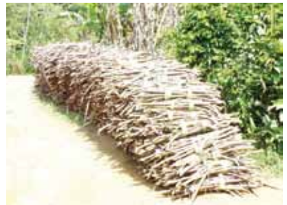
Cana vendida para o Alambique Coqueiro