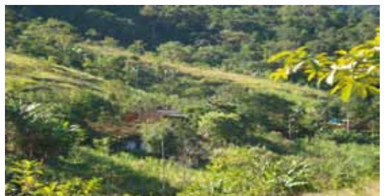
Habitação em meio às culturas diversificadas, próximo à mata