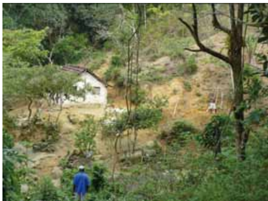
Núcleo dos Alves