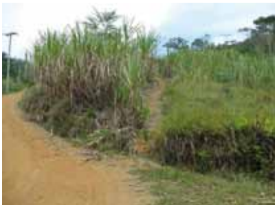
Área de roça familiar repartida com cana, milho e mandioca