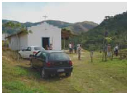
Quilombo de Cabral, ao fundo Igreja Católica

Ainda em 2008 estava em construção nos fundos da Igreja Católica um posto de saúde. Hoje os moradores contam com o Programa Saúde da Família. Sua implementação foi resultado de uma negociação