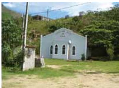
Igreja Protestante Congregação Cristã