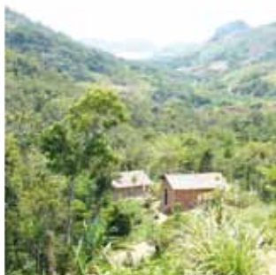
Vale do Cabral, visto do Alto do Lucas