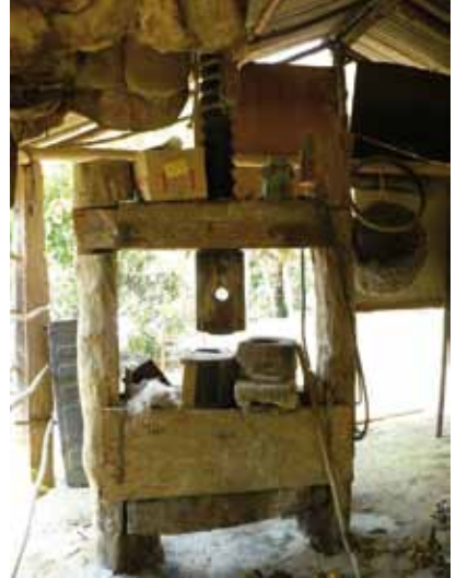
Processo de fabricação da farinha