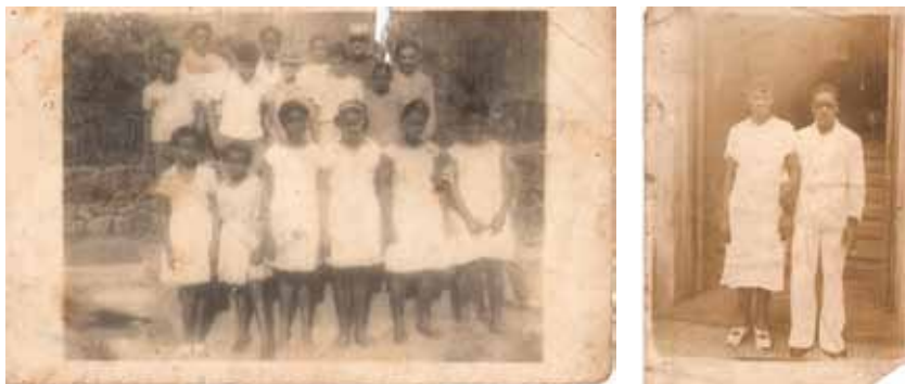
Fotos antigas de moradores do bairro do Cabral