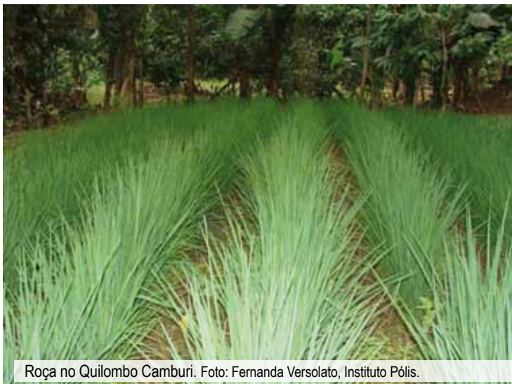
Roça no Quilombo Camburi.

Frequentemente usavam plantas medicinais para curar enfermidades. Esse conhecimento foi herdado dos indígenas que passaram a fazer parte da comunidade, a partir do casamento contraído principalmente com mulheres de famílias locais.