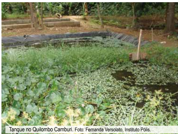
Tanque no Quilombo Camburi.

Na pesca, empregavam várias técnicas como a tarrafa, herdada de indígenas, o caceio, de origem portuguesa e que necessita de três pescadores para ser realizada, e o picaré, indicado para peixes pequenos e pescas rápidas. Em todas essas variações é usado o espinhel – uma corda longa para prender anzóis – e diferentes tipos de redes. Observavam a posição e o formato das nuvens, para saber a direção do vento. Observavam, também, a lua para se orientar no mar. Esse conhecimento permitia que soubessem quando era aconselhável entrar no mar, o que garantia sua segurança.