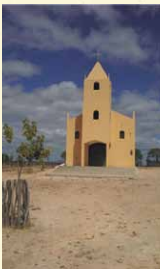
Capela de São Francisco

Apesar das dificuldades, temos grandes conquistas, como o acesso à terra, as casas de alvenaria, a reforma da escola, a construção de açudes e de barragens subterrâneas. Além da chegada da Iluminação pública, a construção de cisternas, da Capela São Francisco, e da Sede da Associação. Falta, no entanto, a maior de todas as conquistas: o título definitivo da nossa terra. Unidos, e com o apoio de comunidades vizinhas, temos certeza de que esse sonho logo se transformará em realidade.