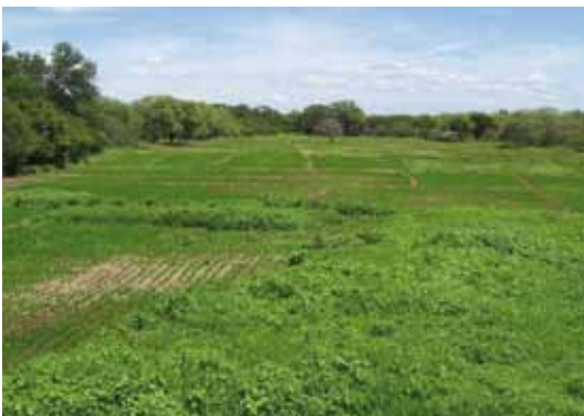
Roça de arroz no território quilombola

Nos quintais das casas, os moradores de Contendas costumam plantar também árvores frutíferas, como mangueiras, cajueiros, limoeiros e abacateiros. Plantam ainda mandiocas (macaxeiras) e pequenas ervas, que são utilizadas na produção de remédios caseiros para as mais diversas enfermidades. A água utilizada na cozinha ou no banho escorre para o quintal, aguando as plantas e assim garantindo o cultivo, independentemente dos períodos de seca.