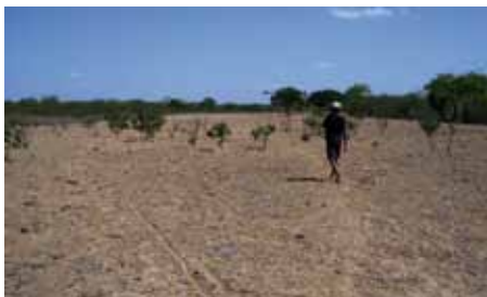
Baixio , área de roça no Logrador em período seco. Ao fundo, as mangas