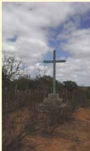
Cruzeiro de Contendas