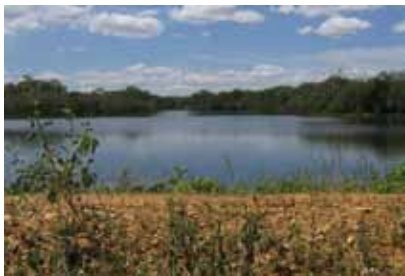
Açude da Trindade

Como todo sertanejo nordestino, os quilombolas constantemente sofrem devido à falta de chuvas, escassas na maior parte do ano. Por não contarem com nenhuma tecnologia de irrigação, dependem da água das chuvas para as suas plantações, bem como para seus açudes. Adaptados a essa realidade há muitas décadas, os moradores de Contendas mantêm calendário rígido dos períodos de plantio e de colheita de cada uma de suas culturas.