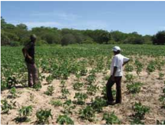
Roça dos quilombolas: sem divisões aparentes