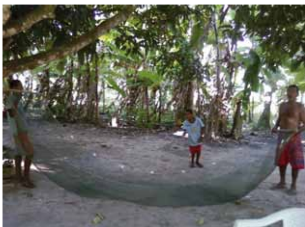
Rede de pesca produzida na comunidade

As plantações na comunidade são de coqueiros da baía e de bananeiras, além de culturas de subsistência, como a mandioca, e as temporárias, como milho, maracujá, abacaxi e feijão, cultivadas em