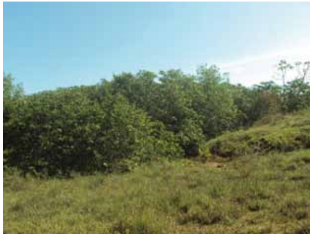
Área de mangue do Quilombo Desterro

pequenas áreas, na maioria das vezes, nos quintais das casas. Alguns quilombolas criam gado bovino. Outros criam peixes e camarões em viveiros. A pesca artesanal no Rio Real também é realizada ainda hoje. Nas áreas de mangue, o extrativismo de caranguejos, ostras e siri é possível, mas em condições bastante limitadas.