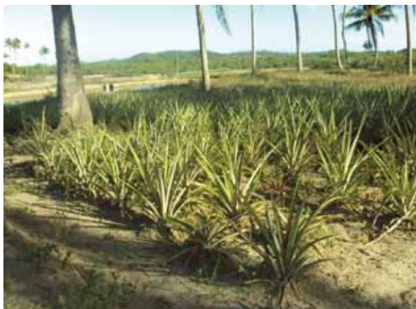
Plantação de abacaxi no Quilombo Desterro