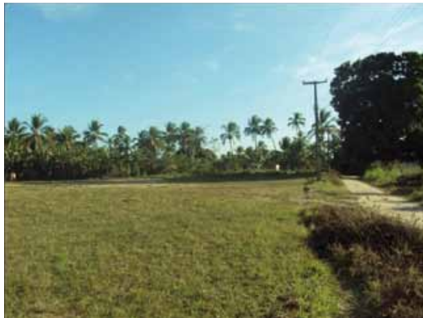
Área de lazer do quilombo Desterro

A antiga Capela Nossa Senhora do Desterro também era um lugar sagrado. A comunidade almeja a construção de uma nova capela para revigorar sua devoção.