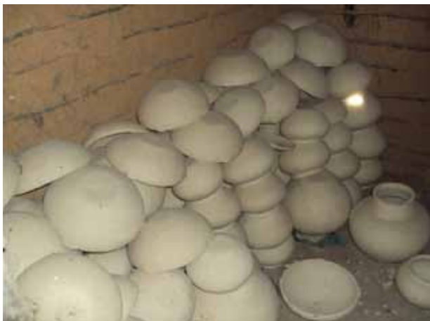
Potes de barro produzidos na comunidade