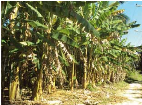
Bananal do Quilombo Desterro