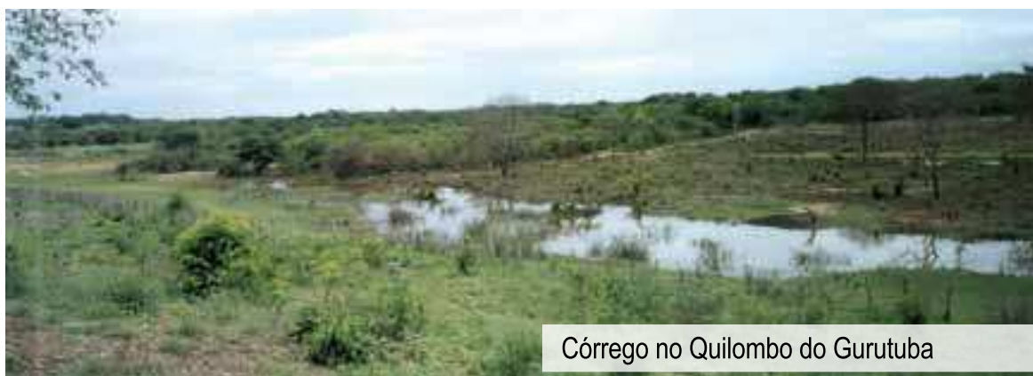
Córrego no Quilombo do Gurutuba

Nesse mapa, o capão e o carrasco ficaram reduzidos a alguns pontos com potencial lenheiro baixo, médio ou alto, ou com algum potencial madeireiro. No saber gurutubano, porém, o capão e o carrasco têm muitas outras possibilidades, incluindo a produção agrícola, a criação de animais e o extrativismo pela coleta de plantas medicinais,