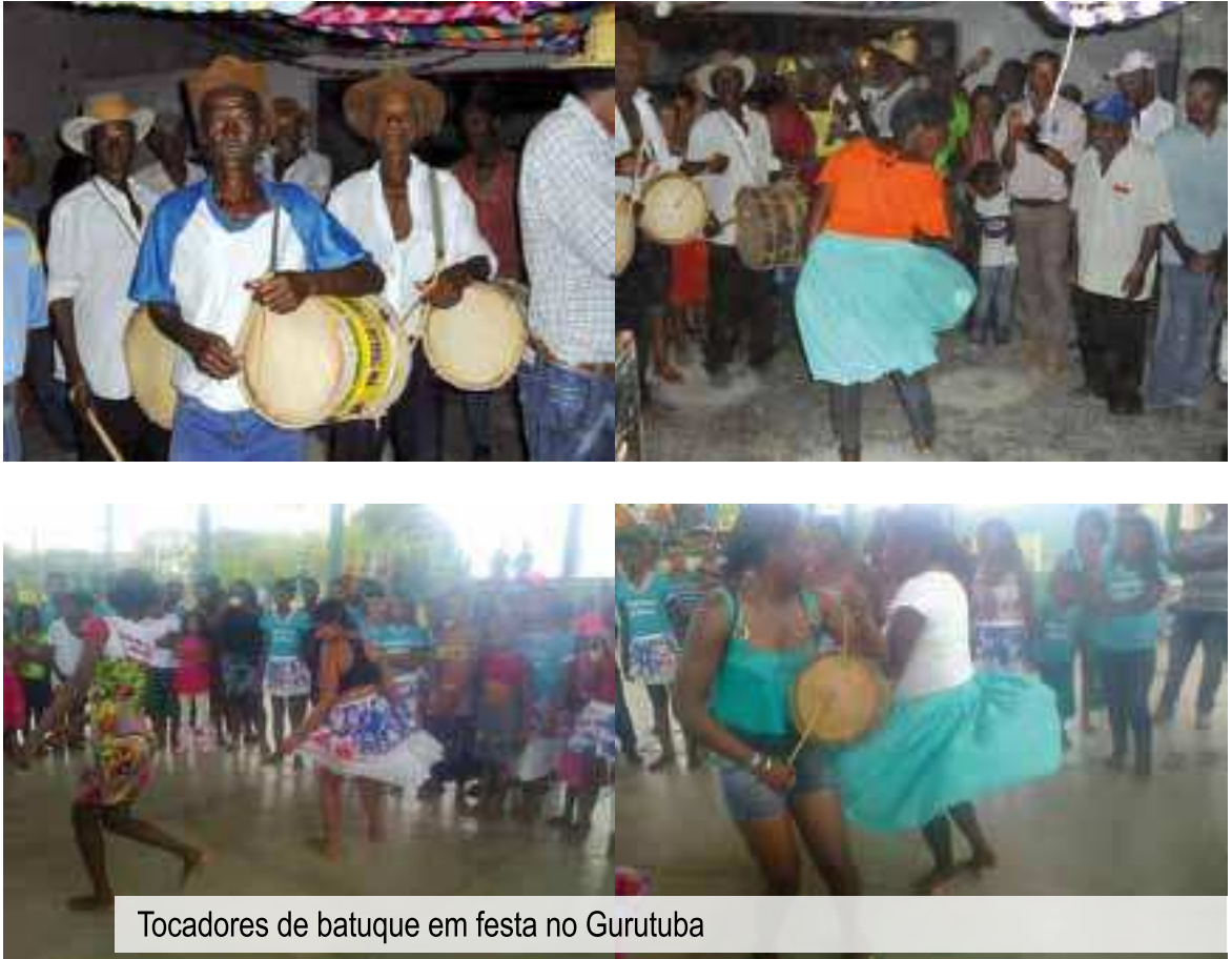
Tocadores de batuque em festa no Gurutuba

Uma das marcas identitárias mais fortes dos gurutubanos é seu batuque tradicional, presença obrigatória nos ritos religiosos e festas da comunidade. Ao som de tambores e caixas, dança-se em círculo com um casal no meio. De tempos em tempos, os pares vão se alternando, até que todos tenham dançado. Quanto mais habilidade, leveza e destreza ao gingar o corpo sapateando, mais bonito e animado o batuque, no qual os gurutubanos também cantam versos desafiadores ou de festejos. Nos casamentos, é tradicional as mulheres dançarem com um pote de barro na cabeça quebrando-o ao fim do batuque.