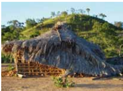
Casa de taipa e adobe de Raimundo e Aparecida, antes e após ser destruída durante o despejo.