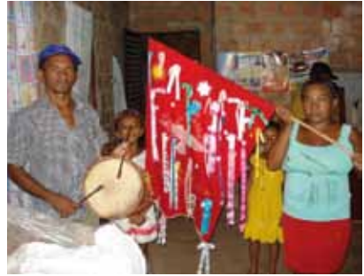
Caixa de folia, instrumento utilizado nas folias; e Bandeira do Divino Espírito Santo.