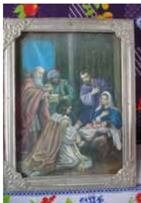
Caixa do Divino Espírito Santo e Quadro de Santos Reis.