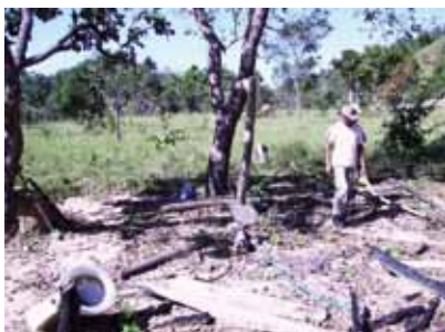
Casa incendiada durante o despejo, com utensílios quebrados e esparramados pelo chão.

Devido a essa situação extrema enfrentada, depois de anos sem esperança, a comunidade voltou a acreditar na recuperação de suas terras, a partir da publicação do RTID em 2011, e posterior promulgação do decreto que confirmou a definição dos 2.096,9455 hectares como território quilombola do Grotão, em dezembro de 2013. O decreto reconhece o direito dos quilombolas às terras ocupadas por seus ancestrais desde meados do século 19, quando fugiram da escravidão em busca de liberdade. Mas, a devolução dessas terras ainda não aconteceu.