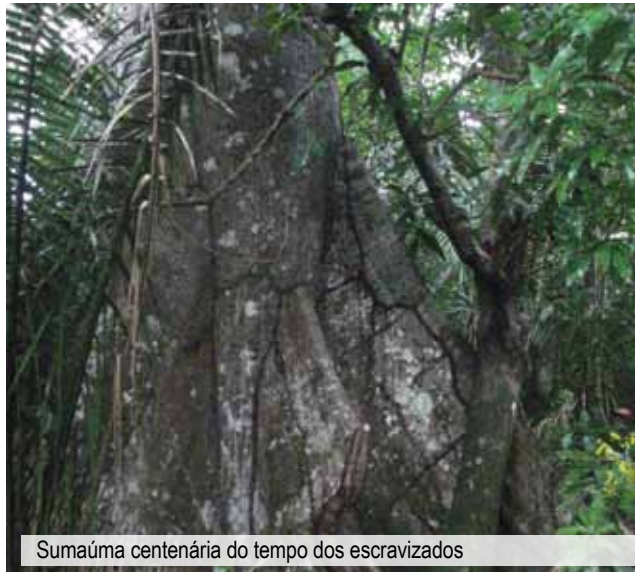
Sumaúma centenária do tempo dos escravizados

Além das mangueiras, outras árvores são lembradas por terem sido plantadas ainda no tempo da escravidão, como uma sumaúma centenária localizada na comunidade Ribeira, e outra que fica entre as comunidades de Teso das Taperas e Frade. Segundo os quilombolas, essas árvores serviam de orientação para quem chegava pelo Porto da Gambarra e se dirigia a Monge Belo.