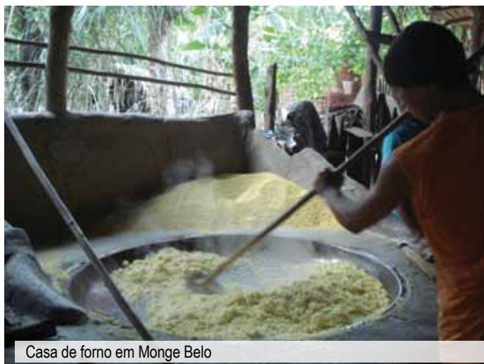
Casa de forno em Monge Belo

Além da produção agrícola focada na mandioca, milho e feijão, os quilombolas coletam vários frutos, como manga, quiriri, goiaba, cuaçu, tarumã, sapucaia, mamão, tuaru, tuturubá e guapel. Outros produtos são encontrados nas roças mais distantes e nas pequenas áreas cultivadas perto das moradias, entre eles a vinagreira, batata-doce, maxixe, pepino, melancia e abóbora. Atualmente, a produção agrícola está ameaçada devido aos conflitos em torno da posse da terra, que levam à diminuição da área cultivável. A devastação e a restrição das áreas do território também levaram à diminuição das caças, que ocorriam no passado.