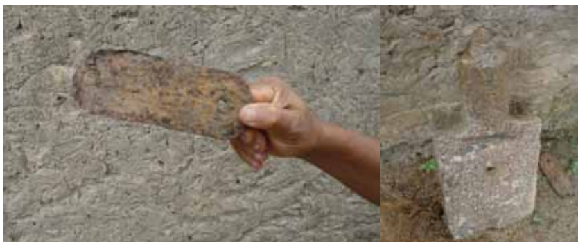
Peças do antigo engenho a vapor que funcionava em Monge Belo

Todos esses marcos que remetem ao tempo do cativo – as grandes árvores, as malhadas, as cacimbas, os lagos – ganharam um novo sentido. São agora símbolos da resistência, conquista de autonomia e controle do território. Hoje, um antigo tacho de ferro que os senhores