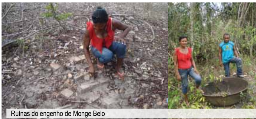
Ruínas do engenho de Monge Belo