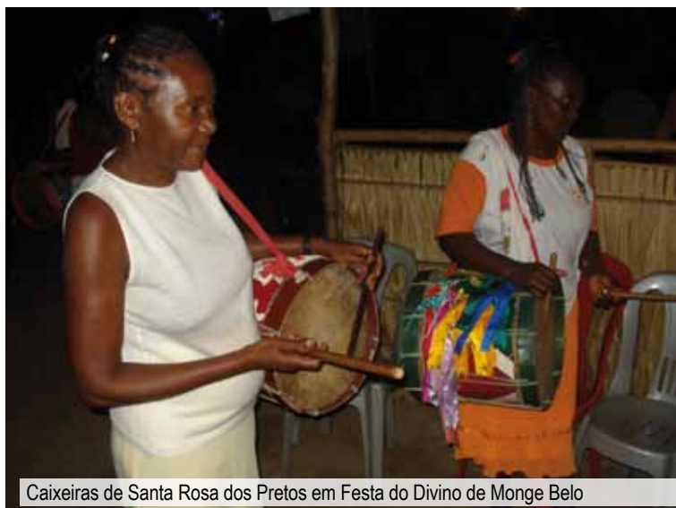
Caixeiras de Santa Rosa dos Pretos em Festa do Divino de Monge Belo

A Festa do Divino é uma das mais concorridas de Monge Belo, reunindo conhecidos, parentes e quilombolas de outros territórios, como é o caso das caixeiras de Santa Rosa dos Pretos. São tocadoras de caixas de percussão, encarregadas de arrecadar dinheiro para a festa. No passado, havia caixeiras em várias comunidades negras do Vale do Itapecuru, mas em Santa Rosa, que é vizinha a Monge Belo,