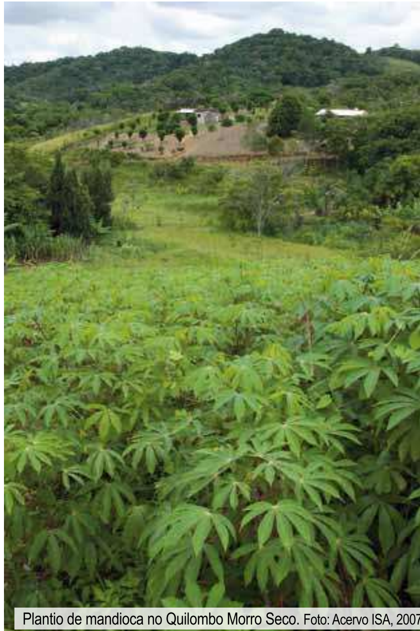
Plantio de mandioca no Quilombo Morro Seco.