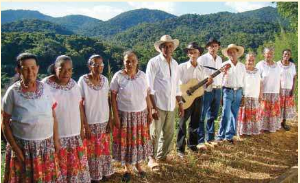
Grupo de Fandango de Morro Seco. Foto: Acervo ISA, 2010.