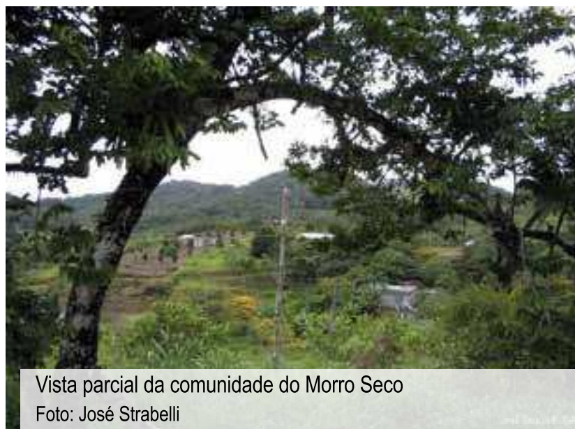
Vista parcial da comunidade do Morro Seco

De acordo com os guardiões da memória do Morro Seco, a terra onde está localizado o quilombo era um lugar de difícil acesso, um sertão de mata alta chamado Capoava, para onde os escravos fugiam. Prova do isolamento do lugar é o fato de que, muitos anos depois da chegada dos fundadores, para ir do quilombo até a cidade