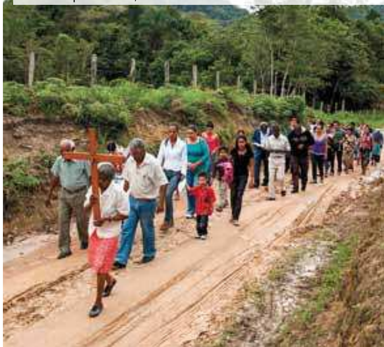
Celebração de São Miguel Arcanjo, Quilombo Morro Seco

A celebração do padroeiro começa com uma procissão cantada e rezada na qual os devotos carregam sua imagem até o interior da igreja que leva seu nome. Quando a imagem entra na igreja, são proferidos cânticos e rezas, sempre ao som do violão, guitarra e baixo,