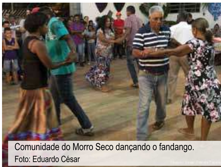
Comunidade do Morro Seco dançando o fandango.