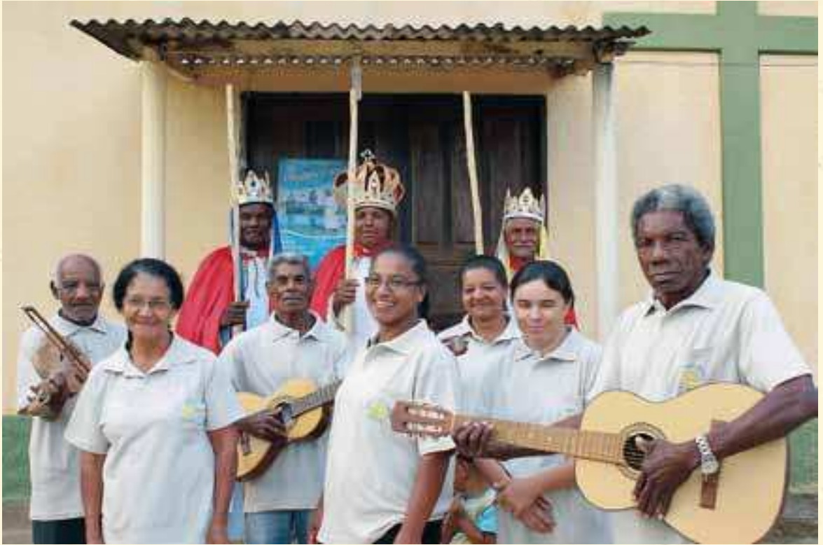
Grupo de Foliões de Reis de Morro Seco. Foto: Juliana Ferreira/ISA, 2012.