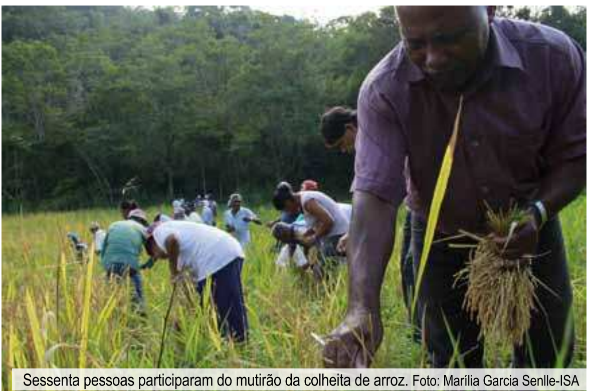
Sessenta pessoas participaram do mutirão da colheita de arroz.

Na atualidade são várias as reivindicações dos moradores do Quilombo do Morro Seco: demandas de infraestrutura, moradia, ensino, saúde, transporte e, principalmente, a finalização do processo de demarcação e titulação do território quilombola. Porém, devem ser registrados os avanços que a comunidade alcançou nos últimos anos, desde o reconhecimento e delimitação do território à preservação de seus saberes e a valorização das suas manifestações culturais. Com essas conquistas, a comunidade