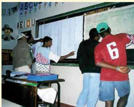
Quilombolas de Porto Velho em reunião para demarcação de seu território tradicional

Entendemos que nosso principal avanço, nos últimos tempos, foi dialogar com o Estado e trabalharmos coletivamente. De modo geral, estamos bem organizados dentro do Vale do Ribeira. Dessa forma, rendemos homenagens a todas as pessoas do Vale que acordaram e compreenderam o sentido da luta quilombola. Em especial, queremos homenagear a Igreja Católica e o Movimento dos Ameaçados por Barragens (Moab), que foram os primeiros que nos ajudaram e nos orientaram para diálogos e trabalhos com o Instituto de Terras de São Paulo (Itesp), um dos nossos principais parceiros, e a Equipe de Articulação e Assessoria às Comunidades Negras do Vale do Ribeira - SP/PR (Eaacone).