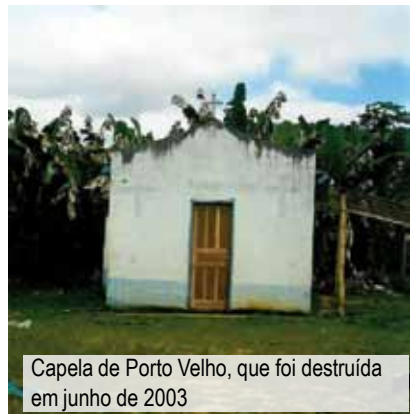
Capela de Porto Velho, que foi destruída em junho de 2003