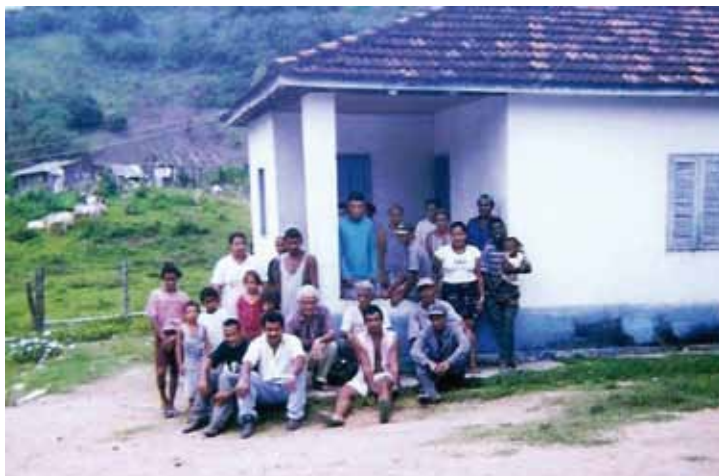
Quilombolas de Porto Velho