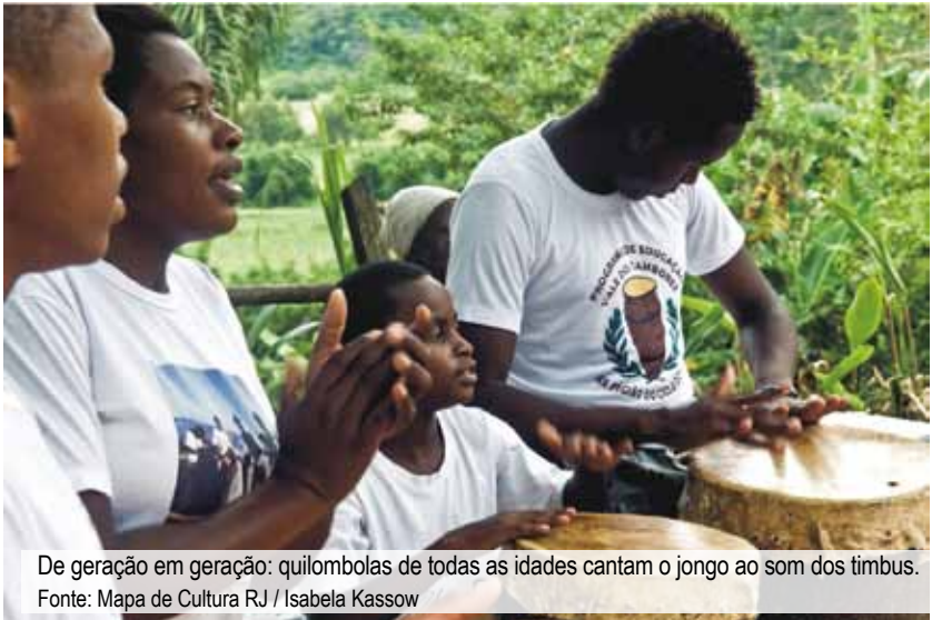
De geração em geração: quilombolas de todas as idades cantam o jongo ao som dos timbus.

Em reconhecimento a sua importância na história do Brasil e do Vale do Paraíba em particular, o jongo foi proclamado patrimônio cultural brasileiro em novembro de 2005 pelo Conselho Consultivo do Instituto do Patrimônio Histórico e Artístico Nacional (Iphan) e registrado no Livro das Formas de Expressão. No processo de inventário foram visitadas sete comunidades jongueiras do Estado do Rio de Janeiro, entre as quais a comunidade da Fazenda São José. O registro do jongo como patrimônio cultural do Brasil é a constatação por parte do Estado de seu papel central na identidade das comunidades