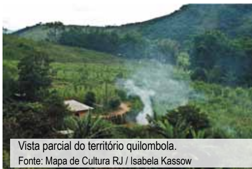
Vista parcial do território quilombola.