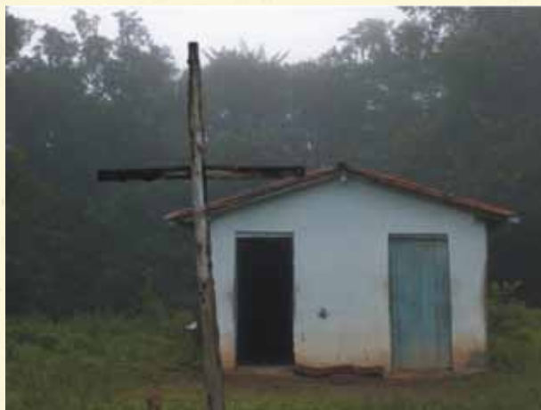
Capela do Cemitério no Alto da Serra.

Sabemos das dificuldades, mas procuramos atuar junto com a comunidade, pois nosso trabalho é todo coletivo e outros parceiros podem encontrar soluções para a melhoria da qualidade de vida dos quilombolas. Muitas ações ainda serão realizadas. Temos um sonho da autossustentabilidade da comunidade Serra da Guia.