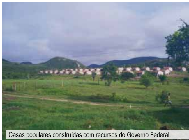
Casas populares construídas com recursos do Governo Federal.

No início dos anos 2000 foram construídas casas com recursos do governo federal para áreas quilombolas, porém, como não foram instalados nem sistema de esgoto ou de tratamento de água, as condições de higiene se mantiveram precárias. Além disso, as casas foram construídas muito próximas umas das outras, diferentemente do padrão tradicional de residência, no qual eram separadas por algumas centenas de metros e organizadas ao redor dos núcleos familiares. Alguns moradores consideram que a proximidade das casas seria a principal causa de tensões e conflitos atualmente vivenciados na Serra da Guia.