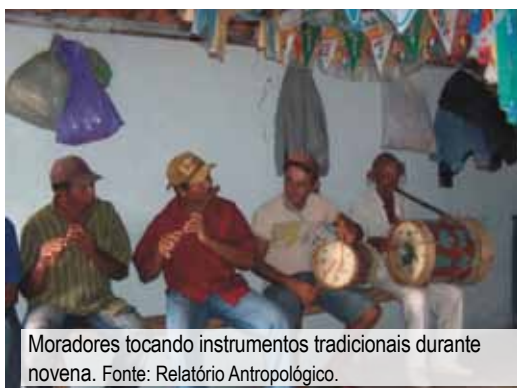
Moradores tocando instrumentos tradicionais durante novena.